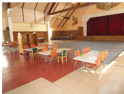
Espace repas + de 6 ans